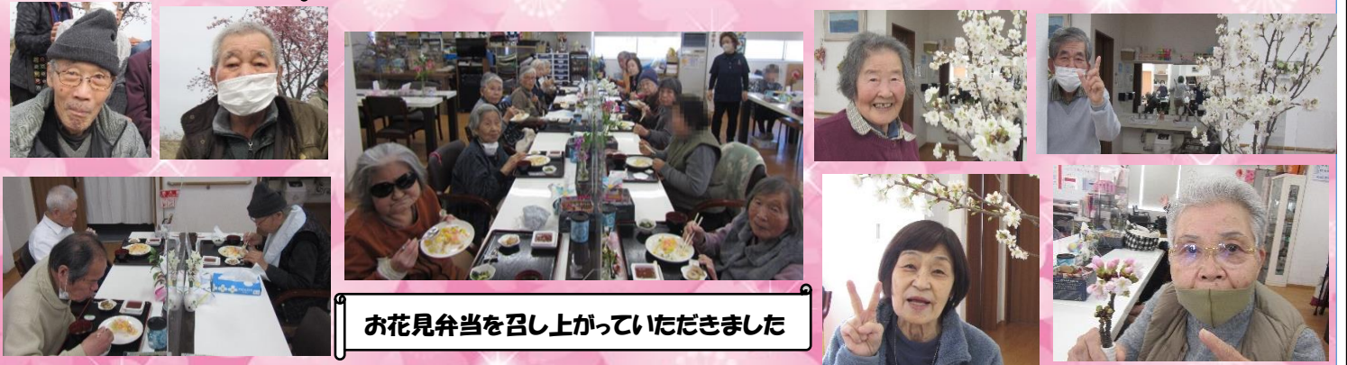
お花見弁当を召し上がっていただきました