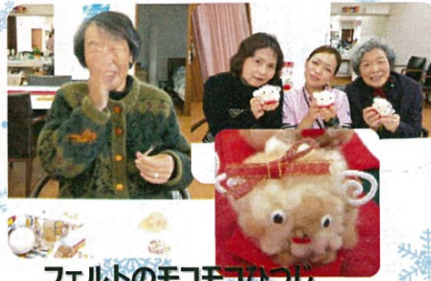
フェルトのモコモコつむ