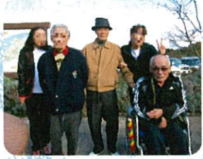
紅葉散策～深山公園～