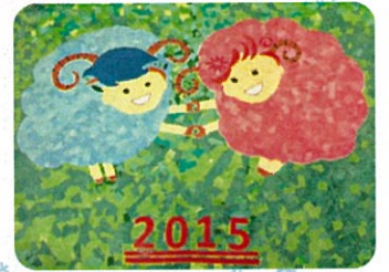
季節の壁画～貼り絵～